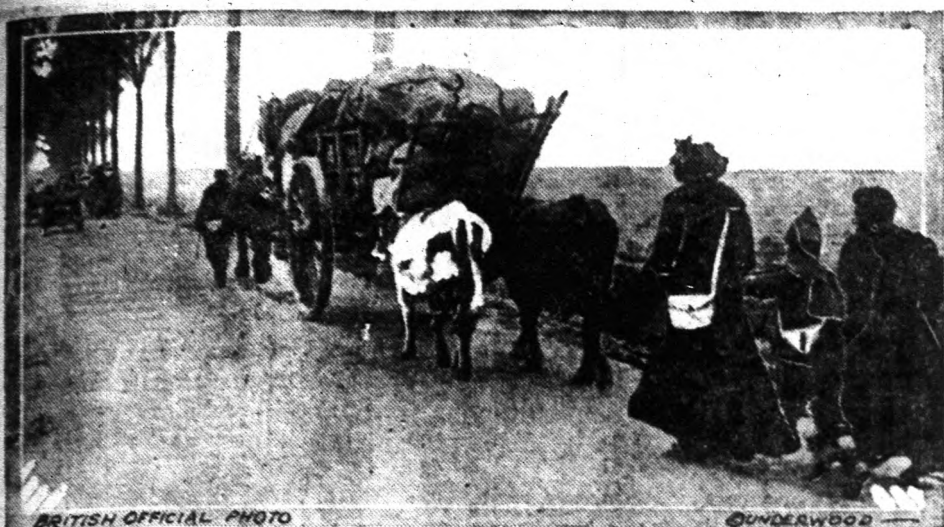
A német offenzíva alatt a franciáknak nem egy helyről kellett hanyat-homlok menekülni. Mindenüket hátrahagyták, kis házukat és minden ingóságukat, csak azért, hogy minél hamarabb elérhessenek a hadvonalak mögé, ahol már nem fenyegette őket semmi veszedelem.