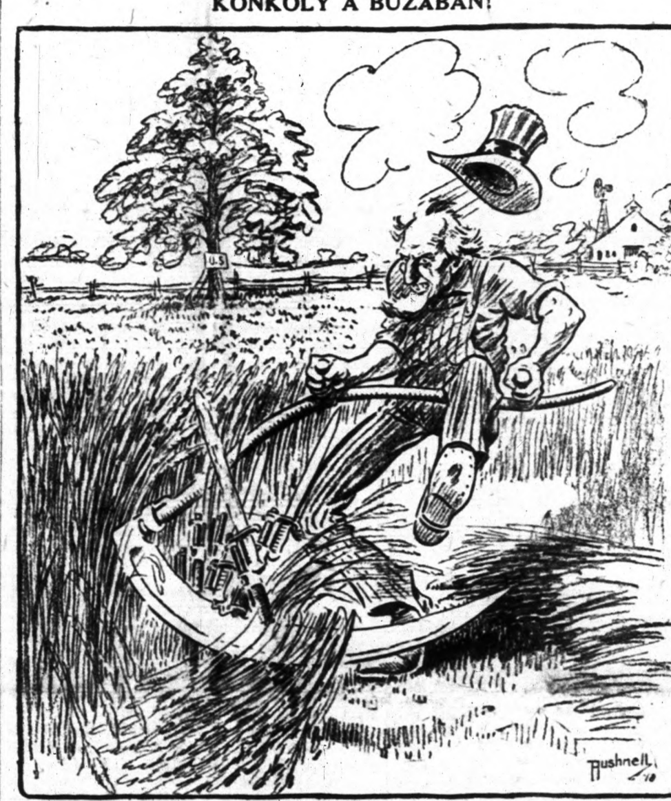
KONKOLY A BUZÁBAN!

London, május 18. A Daily Expressnek azt jelentik Amsterdamból, hogy Németországban új törvényt fogadtak el. Az új törvény az a bizottság készített elő, amelyet azért küldött ki a kormány, hogy megvizsgálja a gyermekhalandóság okait, s hogy a baj orvoslására nézve javaslatot tegyen. Az új törvény értelmében minden fiúnak, aki legalább husz esztendőssé, azonnal meg kell nőni. Ha nincsen annyi jóvándó, hogy a feleséget eltarthassa, az állam gondoskodik róla. De meg kell nőni. Gyermekeket, házaspárokat szigorúan meg fognak büntetni.