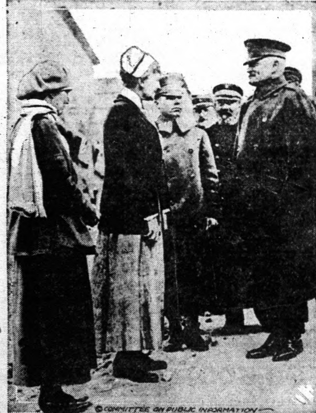
Pershing tábornok, a Franciaországban működő amerikai hadsereg fővezére üdvözlöi az apolonóket, akik nemrég érkeztek meg az Egyesült Államokból, hogy segítségére legyenek a megsebesült amerikai hősooknak.