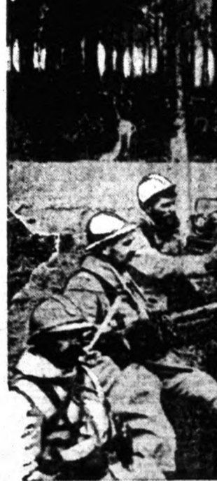
Angol sebesültek a francia hadvonalon haladnak keresztül a német ágyúknak legnagyobb tüzeinek és a német gyalogság legelkeseredettebb támadásának közepette. De azért jól érzik magukat.