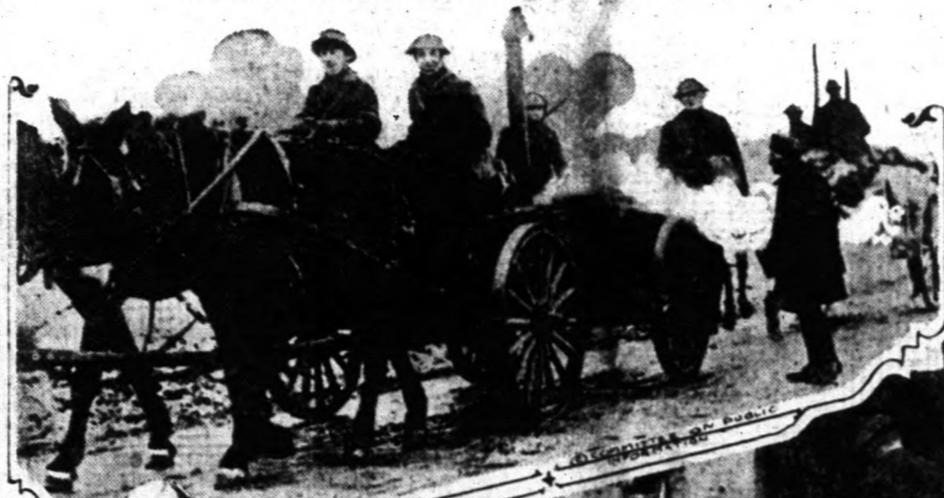
AMERIKAI KATONAK A NYUGATI FRONTON.

A szakértők szerint az offenzíva első napjainak esatái csak arra valók lesznek, hogy a németek kipróbálják, hogy honnan mentek segélyes csapatok az északi és déli front védelmére és azután a leggyengébb pontra vessék rá magukat teljes erővel. Mindezek a tervek azonban aligha fognak valóra válni, mert a szövetséges hadvezetés egészen szándékosan minden eshetőségre. A németeket már az első napon meglepés érte, amikor az aisei hartereken angol seregeket is találtak, holott azt hitték, hogy ott csak francia csapatok védik a vonalakat. Epp ilyen meglepetésben lesz részük a támadások további folyamán is, a mikor rá fognak jönni arra, hogy a szövetséges tartalékseregeket mindenütt szembe fogják találni magukkal.