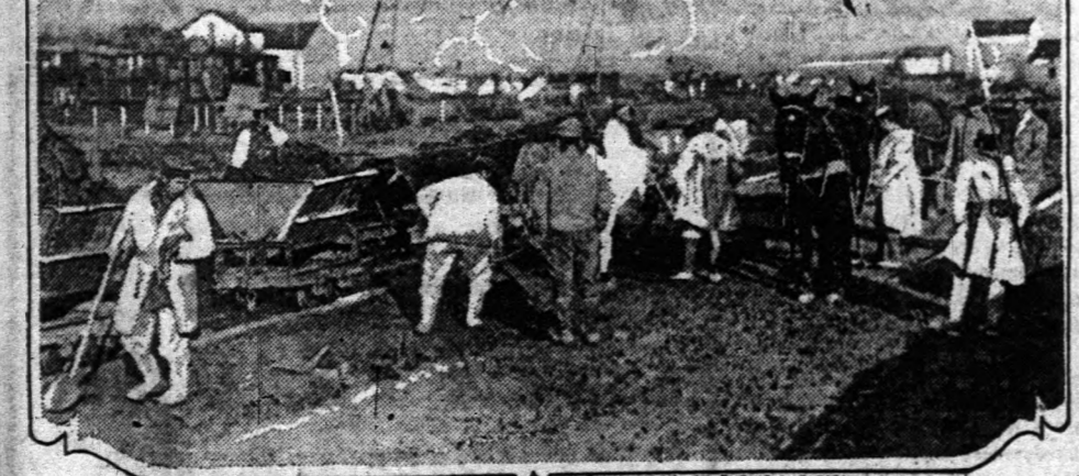
A német hadifüglöket erősen foglalkoztatják az amerikai katonák a franciáországi hadvonalak megett.