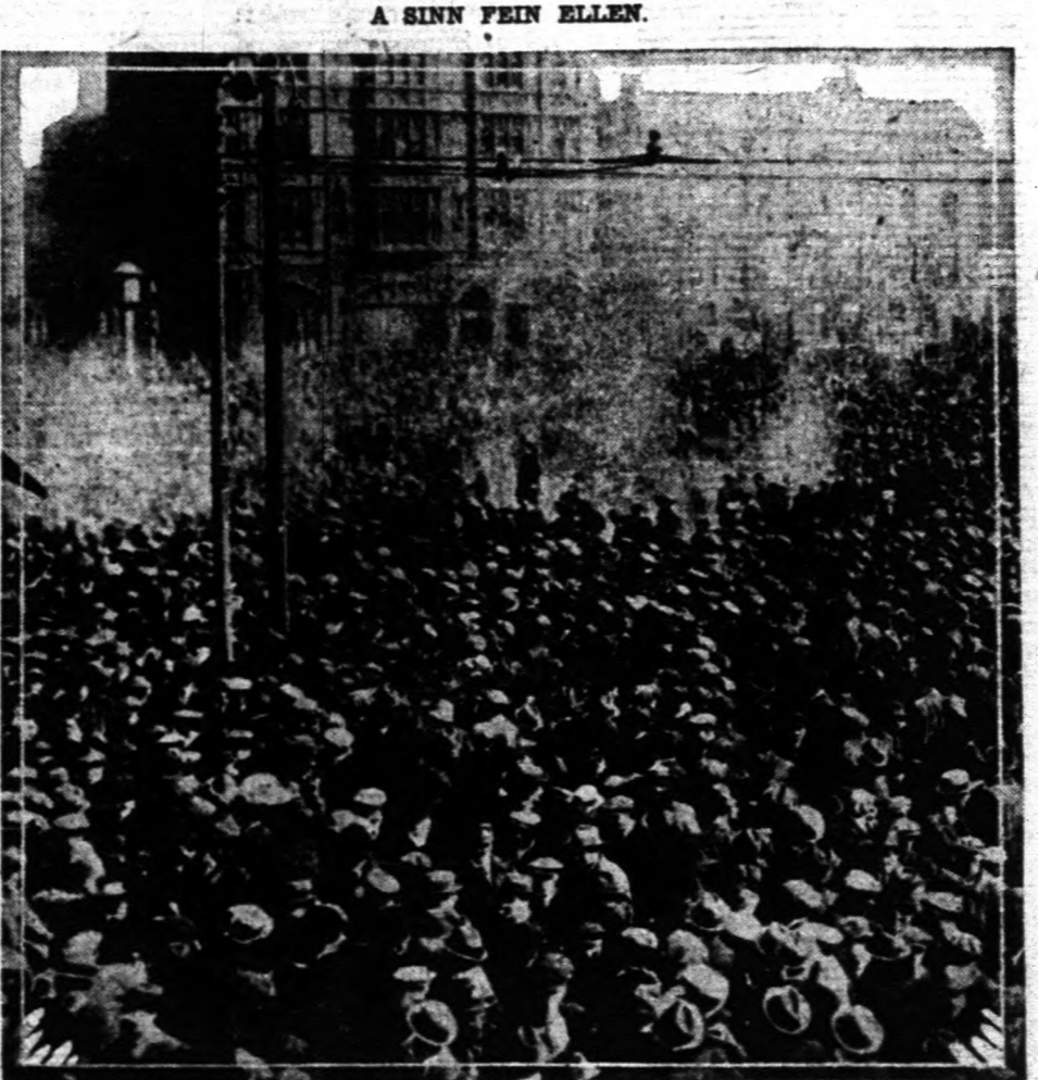
A Sinn Fein társaság Dublinban legutóbb ismét nagy tüntetéseket rendezett. Egy ilyen tüntetésen orszákkal vetettek végett a városban levő egyik hajógyár munkásai. Az utóbbi időben, mióta az ir. nacionalista vezérek, John Dillon és Joseph Devlin nyilatkoztak, a Sinn Fein sokat veszített hatalmából.

Páris, jun. 5. Azok a francia és angol kiképző tisztek, akik a franciaországi kiképző táborokban az amerikai csapatokat oktatták, rendkívül nagy elismeréssel nyilatkoztak a Sammykről. Kijelentették, hogy rendkívül gyorsan tanulják el a modern hadviselés szabályait, és mellett pedig lépten-nyomon tanubizonyítást tesznek egyéni bátorságukról és önálló gondolkodásukról. A Sammykből kitűnő harcosok fognak válni és nagygyűren meg fogják állani helyüket a harcokban.