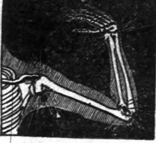
"Ez a fájdalom elűzője, amelyet az egész szervezetem..."

Figyelemre méltó hatóanyagok, akik abban szenvednek. — Minden betegnek javára szolgál. Ne költsön pénzt, csak a címet.