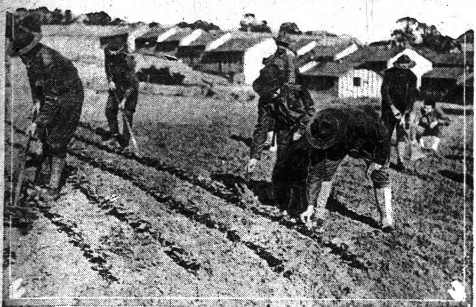
A háboru már Amerikától is megkövetelte a maga áldozatait. Azok a sebesültek, akiket már sikerült visszahozni, most a McPherson telepen dolgoznak.