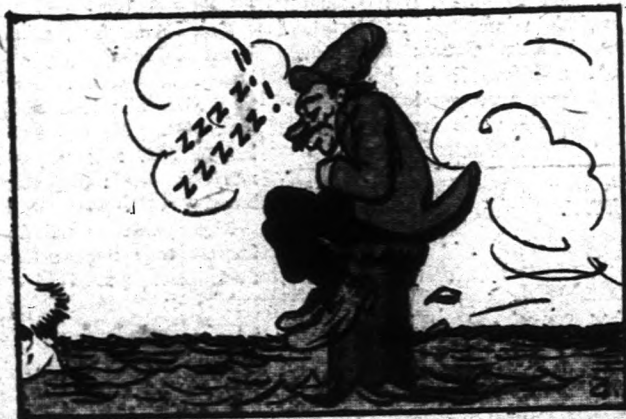
Déli 12 óra.