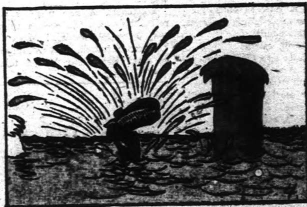
12 óra 16 perc.