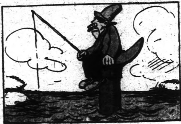
Reggel 8 óra.