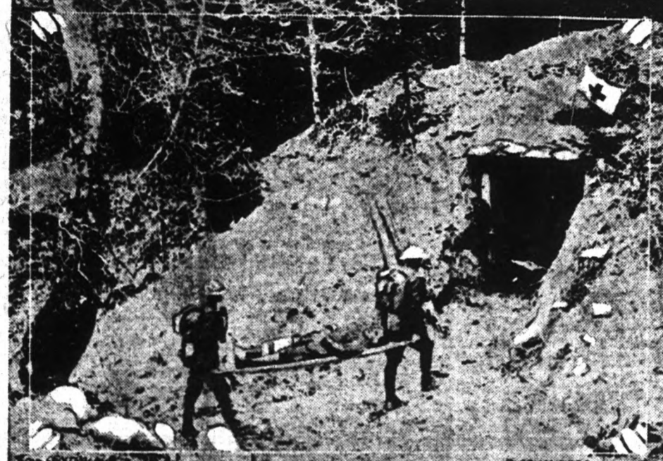
Vörös Keresztes kötőállomás közvetlen a tüzvonal mögött az amerikai fronton.