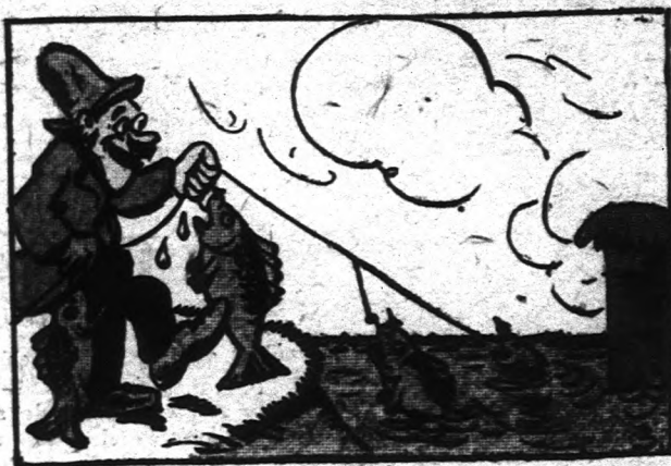
12 óra 15 perc.