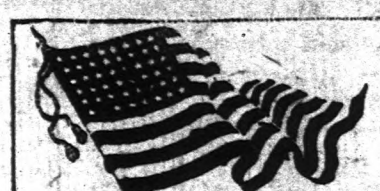
A legnépszerűbb és legnagyobb magyar nyelvű újság Amerikában. Megjelenik minden nap.