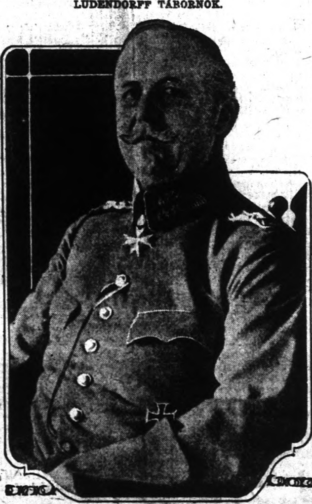
Ludendorff generális, a németek igazi vezetője, akit a franciák "ördögi tehetségnek" neveznek.

Washington, Julius 16. Wilson elnök hétfő délután a hadügyminiszterrel, ahol háromnegyed óra hosszat tartózkodott. Baker hadügyminiszter folytatott tanácskozást a nyugati harctérrel érkezett jelentésekkel kapcsolatban.