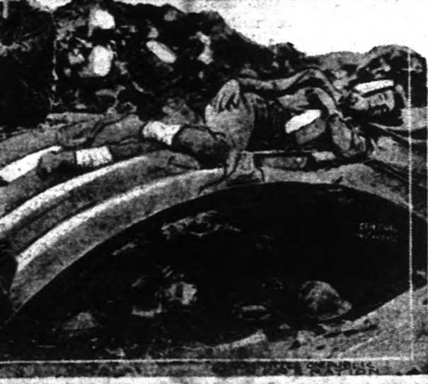
Fent: Amerikai gyalogság pihenőt tart Franciaországban az angol támaszai vonal mellett, mielőtt újra üldözése vonná a németeket. - Lent: Amerikai fluk egy állásott francia faluban, egy "aranyas helyen" pihenőt tartanak.