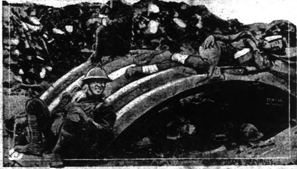
Fent: Amerikai gyalogság pihenőt tart Franciaországban az angol támaszai vonal mellett, mielőtt újra üldözése vonná a németeket. - Lent: Amerikai fluk egy állásott francia faluban, egy "aranyas helyen" pihenőt tartanak.