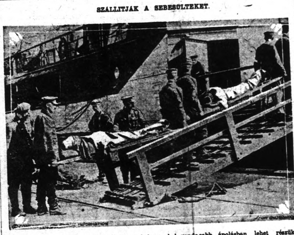
A súlyosan sebesülteket elszállítják olyan helyre, ahol gondosabb ápolásban lehet részük.

Stockholm, aug. 13. — Helsingforsi távirat szerint a finn parlament hosszas és heves vita után akként határozott, hogy Finnország a királysági államformát fogadja el és szeptember hó folyamán királyt fog választani. A királyt ama törvények szerint fogják megválasztani, mint azt az 1772-ik évi parlament megállapította.