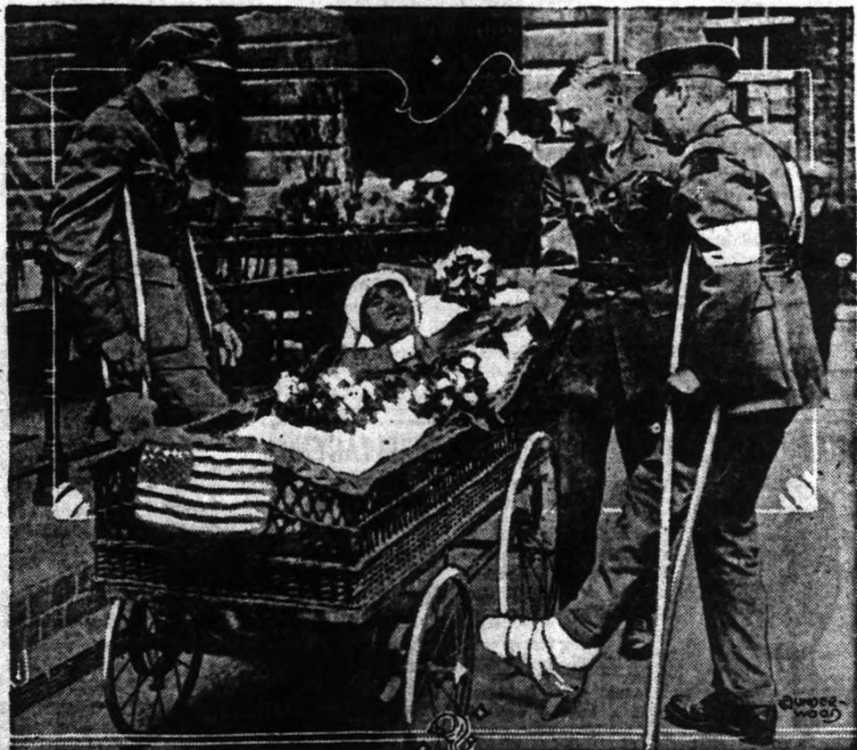
A nyugati harcmezőn súlyosan megbetegedett egy ápolónő a kórházba került. A katonák, akiket aszalt kasszák, a kórházi ágyon virággal halmozták el.