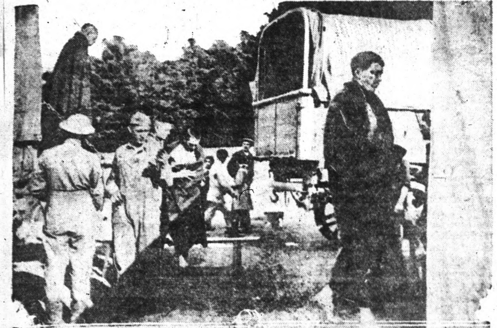
Német repülőgépek a napokban bombázták a Jouy melletti amerikai hadikórházat, miközben az amerikai sebesülteket megölték a német bombák. Képünk azt mutatja, amint a jouyi kórházba sebesülteket szállítanak.