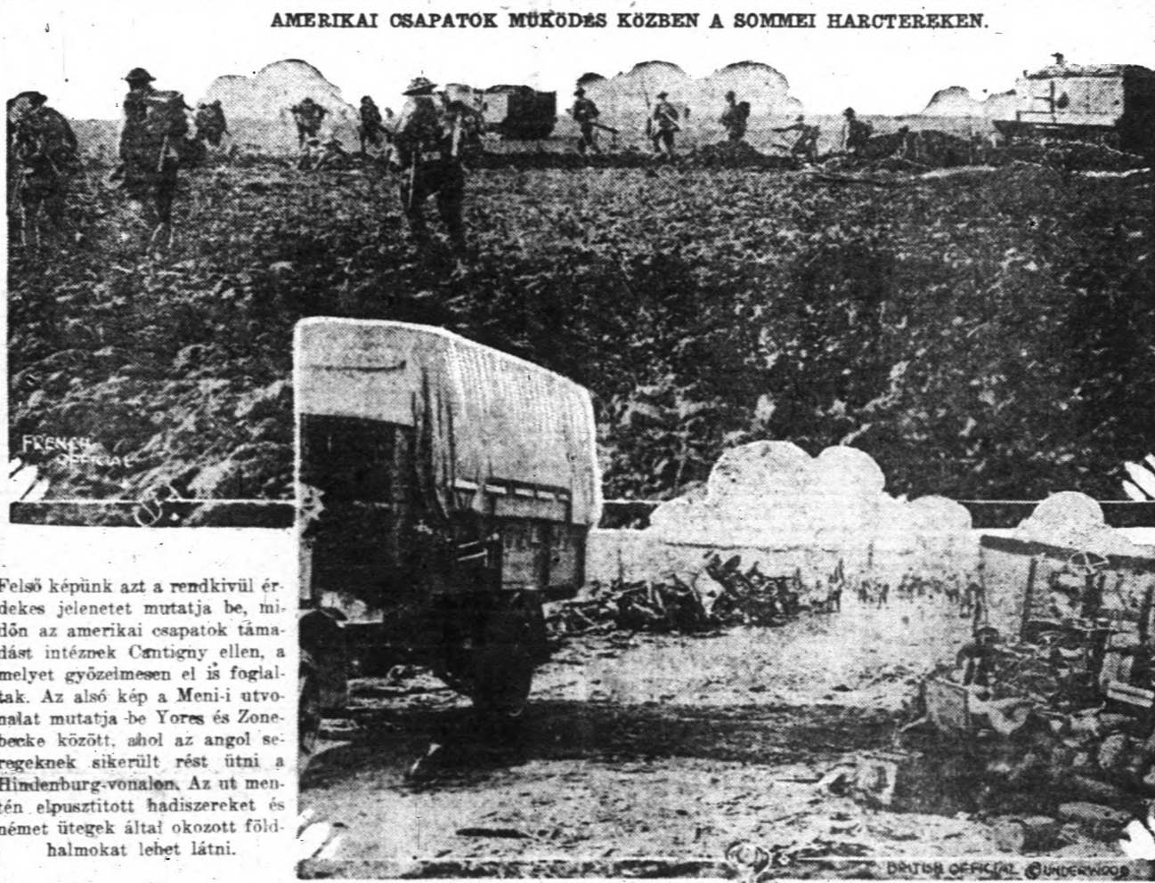
AMERIKAI OSZAPATOK MŰKÖDÉS KÖZBEN A SOMMEI HARCTEREKEN.

A másik nagyfontosságú újítás lesz az, hogy egy nagy vezérkart fognak alakítani a szárazföldi hadsereg és a haditengerészet tisztjeiből, amely a haderő összes ügyeit irányítani és felvilágosítani fogja. Ez a katonai testület fogja átvenni ama katonai ügyek vezetését is, amelyeket eddig nagybörzést polgári tisztviselők intéztek. A vezérkar felállítására egyben az első lépés lesz arra is, hogy rövidebben teljesen összeolvassák a tengerészeti minisztériumot a hadügyminisztériummal.