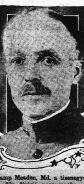
Camp Meaden, Md. tábornok.