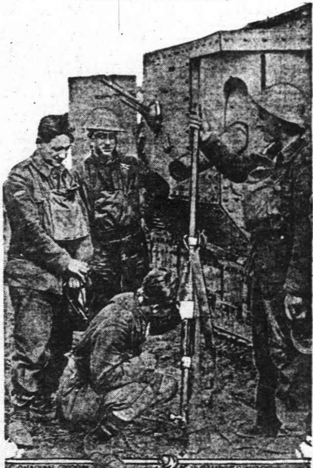
A németek legújabb fegyvere egy hatalmas puska, amely nagyban hozzájárul ahhoz, az 5 véleményük szerint, hogy a szövetséges tankjai ne mehessenek gyorsabban előre.