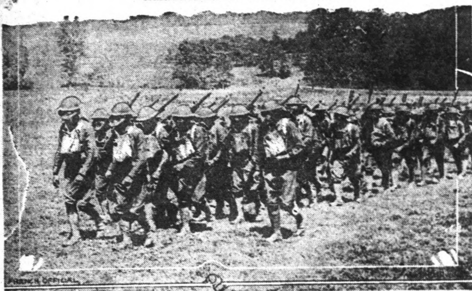
Az Egyesült Államok katonái, gázmaszkal a fejükön, útközbe mennek.