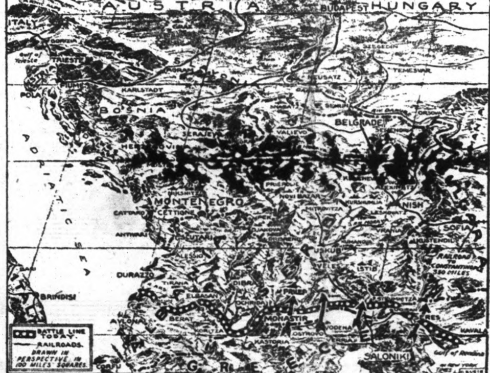
Képvonok bemutatjuk a balkáni harctereket, ahol a szövetséges seregek nagy sikerrel szorítják vissza az egyesült bolgár, osztrák és német hadakat. A terep rendkívül hegyes és inkább védelemre, mint támadásra alkalmas. A szövetségesek már átlépték a bolgár határt és mélyen bent járnak Szerbiában.