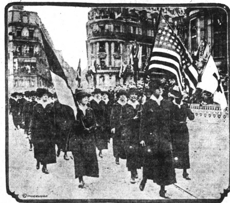
Egy amerikai Vörös Kereszt női különítmény a francia fővároson át a frontra vonul

Az angol nyelv tanfolyamok hely-lyen nyílnak s hetvenhat kü-lönböző tantárgyat fognak elő-adni bennük. Az iskolahatósá-gok nagyszámú hallgatóságra számítanak, mert mint ismeretes dolog, az esti iskolák közül nem egyben oktánai fogják a férfiakat olyan ismeretekre, a miknek nagy hasznát fogják venni a hárseregben. Lesznek például francia tanfolyamok be-sorozandó hadkötelesek számá-ra s technikai tanfolyamok azok számára, akik a hársereg-ben ipari munkát öhajtanak vé-gezni.