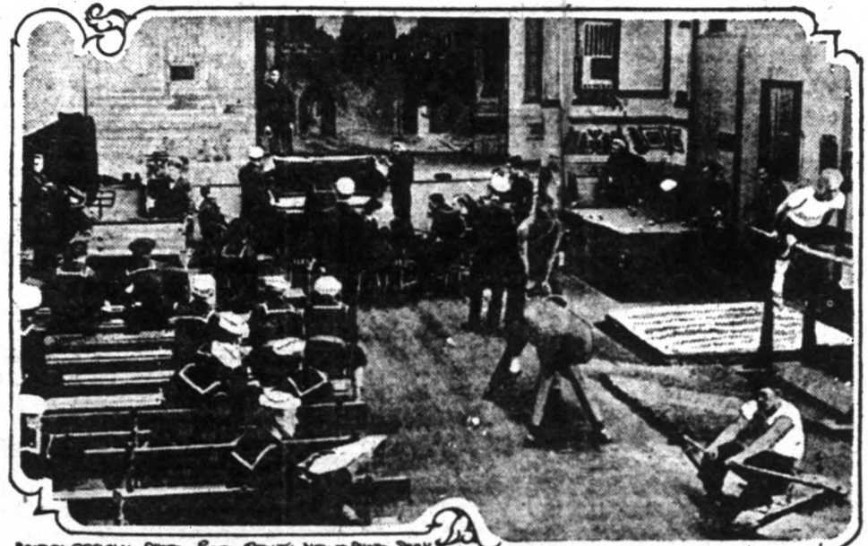
Az angol fővárosban kényelmes klubot rendeztek be az ott tartózkodó amerikai tengerészek számára. Képeink a klub egyik helyiségét mutatja be.