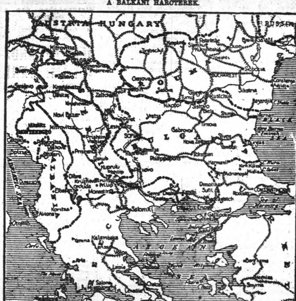
Képzünk a Balkán vasúti hálózatának térképe, melyen látni lehet a kelet felé haladó fontos vasúti vonalakat. A szövetségek jelenlegi offenzívájukban arra törekednek a Balkánon, hogy elvágják a németek vasúti vonalát Konstantinápoly felé, amely esetben Törökországnak is követnie kell Bulgáriát és kénytelen lenne szintén fegyverszünetet kérni a szövetségesektől.