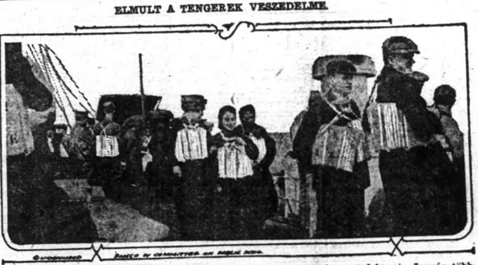
ELMULT A TENGEREK VESZEDELME. Mintán a háború végét ért, elmúlt a tengereken való utazás veszedelem is. Immár több, mint két éve azok, akik megkockáztatták a tengeren való utazást, a köpönyökön látható életmentő felszerelést kellett, hogy viseljék állandóan. Ezentúl az utazók megszabadulnak ettől a teher-től.

Hága, november 19. — Az Antwerpenben megalakult munkások és katonák tanácsa felkérte a berlini tanácsot, hogy azonnal tegyen lépéseket a volt császár, a volt trónörökös és a velük menekült tábornokok kiadása iránt a hollandi kormánynál.