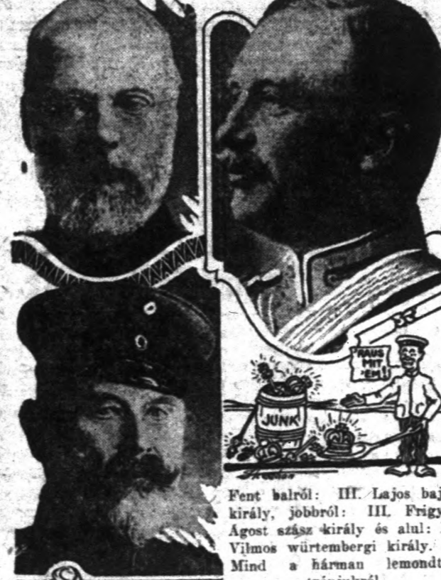
Fent balról: III. Lajos bajor király, jobbról: III. Frigyes Agost szász király és alul: II. Vilmos württembergi király. — Mind a hárman lemondtak trónjukról.