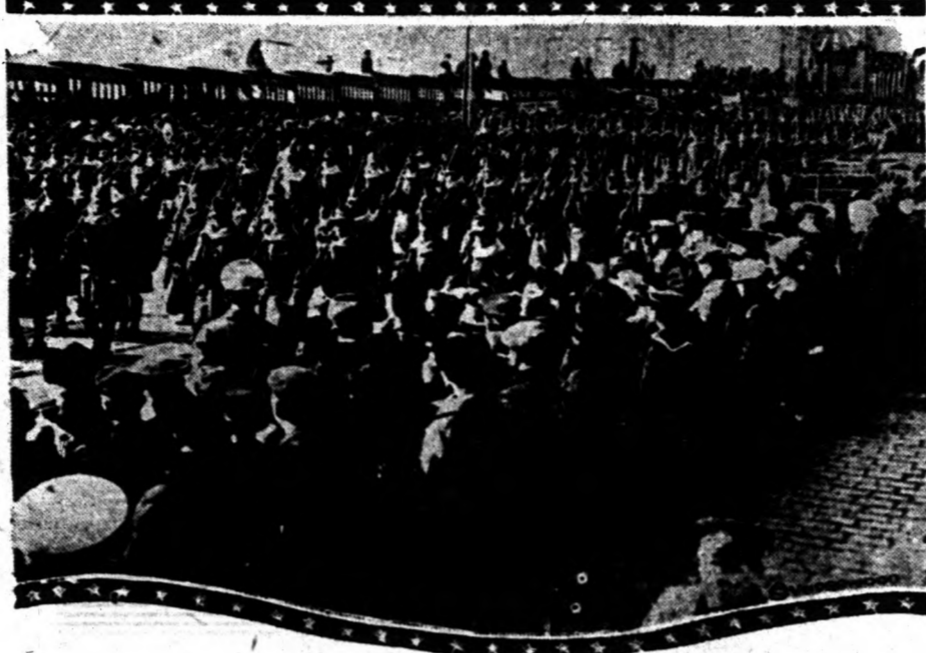
A fegyverszünet alkalmából Uncle Sam fiait ünnepséget rendezek Vladivosztokban.