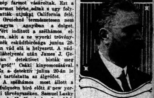
ban vannak Párisba és amit a tudósítások jelentik, több követéssel fognak előállni a békekonferenciára, így a többek közt azaz, hogy Németország fizesse meg azokat a károkat, amelyeket a háború folyamán okozott Romániában, továbbá, hogy Erdélyt és Bessarábiát csatlólják Romániához.

Románia már kikereksze béke-delegátusait, akik a versaillesi békekonferencián az országot képviselni fogják. A delegátusok vezére Bratianu miniszterelnök, akinek arcképet bemutatunk. A román béke-delegátusok már ut-