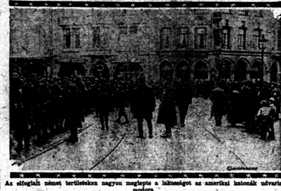
As elfoglalt német területeken nagyon meglepte a lakosságot az amerikai katonák udvarias modora.