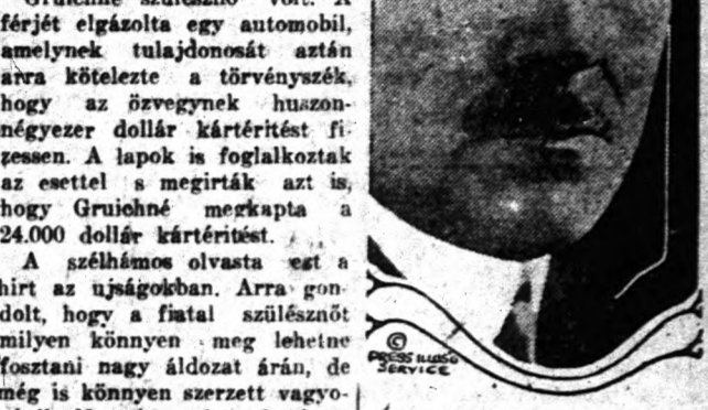
rikába jött, ahol azóta hatalmas tevékenységet fejt ki a lengyelek érdekében. Dnowski most visszatért hazájába, hogy résztvegyen az új Lengyelország megalapozásában.