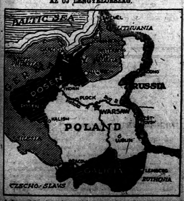
A lengyel új hadsága, amely annyi vérontás árán lett az ország ura.