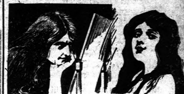
A tükör azt mondja, hogy öregszik. Ismét fiatal és bájos a Vörös Kereszt hajfajtalító használatával.

Vörös Kereszt hajfajtalító visszaadja a haj régi színét és fiatalos kinézetét. A szép, fiatalos haj úgy férfinál, mint nőnél igen fontos s mindig bámulatot kelt.