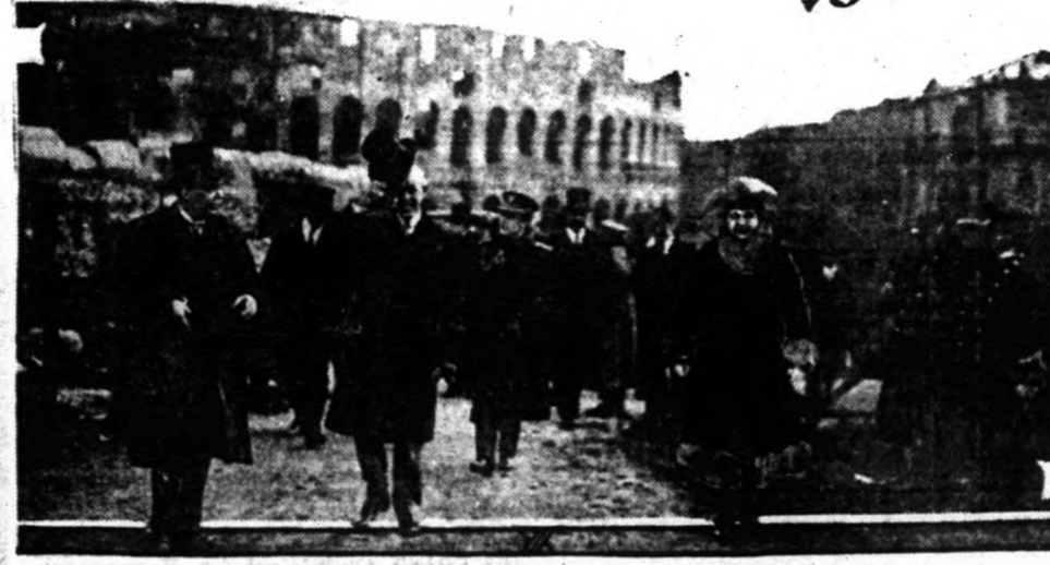
Annak idején beszámoltunk arról, hogy minő meleg fogadtásban részesítette az olasz nép...