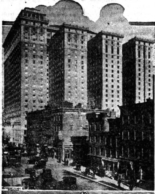
A Pennsylvania Hotel, amely most nyílt meg New Yorkban.