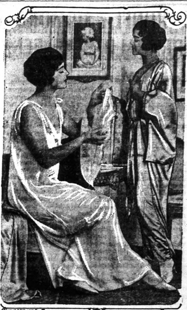
A jobb nő inkelet és alsóruhákat most mind crépe delineből és satinból készítik, amely a hölgyek szerint sokkal puhább, jobban hozzásimul a testhez és melegebb mint bármí más.

Minden élő szervezetben találunk protoplazmát, de nincs olyan élő szervezet, amely teljesen abból lenne felépítve. A szervezet minden része nem é, csak azok a részek, melyek protoplazmából állnak. Azok az anyagok, amelyekből az élő szervezetek alakultak vagy a protoplazmává alakulás állapotában vannak, vagy közvetlen magának a protoplazmának a termékei. Az állatok s növények részei a megülő életfolyamat alatt összegyűjtött termékekből állnak. Így például a növények megfűsült részei, a csigának kagylója, is. Mig a szervezet élő elemei folytonosan változnak, addig a holt részek ugyanazon állapotukban maradnak meg. Az élő szervek mikroszkópi vizsgálása azt mutatja, hogy a protoplazma mindig sejtek alakjában található. Ezzel az életben egy általános eleméletéhez jutunk, az u. n. "sejt elemélet", melyet Schleiden és Schwann állapítottak meg, több mint hetven évvel ezelőtt és mely azóta egy alaki, mint tartalmi tekintetben nagy változaton ment át. A "sejt elemélet" rövidesen a következőkben foglalható össze: a protoplazma egy magból áll és az ezt körülvevő u. n. sejt-testből. Minden növény és állat ilyen sejtből vagy ennek tömegéből van összehívva. A test na-