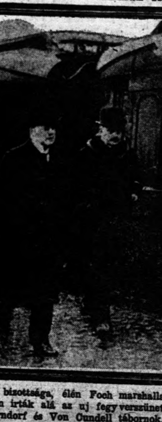
A szövetségesek fegyverszüneti bizottsága, élén Foch marhallal a németországi Trostitzon tartotta ülését, melyek egyikén írták alá az új fegyverszünetet a németek megbízottai: Mathias Erzberger, Gróf Oberndorf és Von Oundell tábornok.

NAGY SZTRÁJK SPANYOL ORSZÁGBAN. Madridból jelentik: A barcelonai sztrájk egyre jobban terjed. Eddig már több mint 50,000-re rug a sztrájkoló száma. A város víz, világítás és közlekedés nélkül van. A kabinet rendkívüli ülésén egész nap a sztrájk-ügyet tárgyalt.