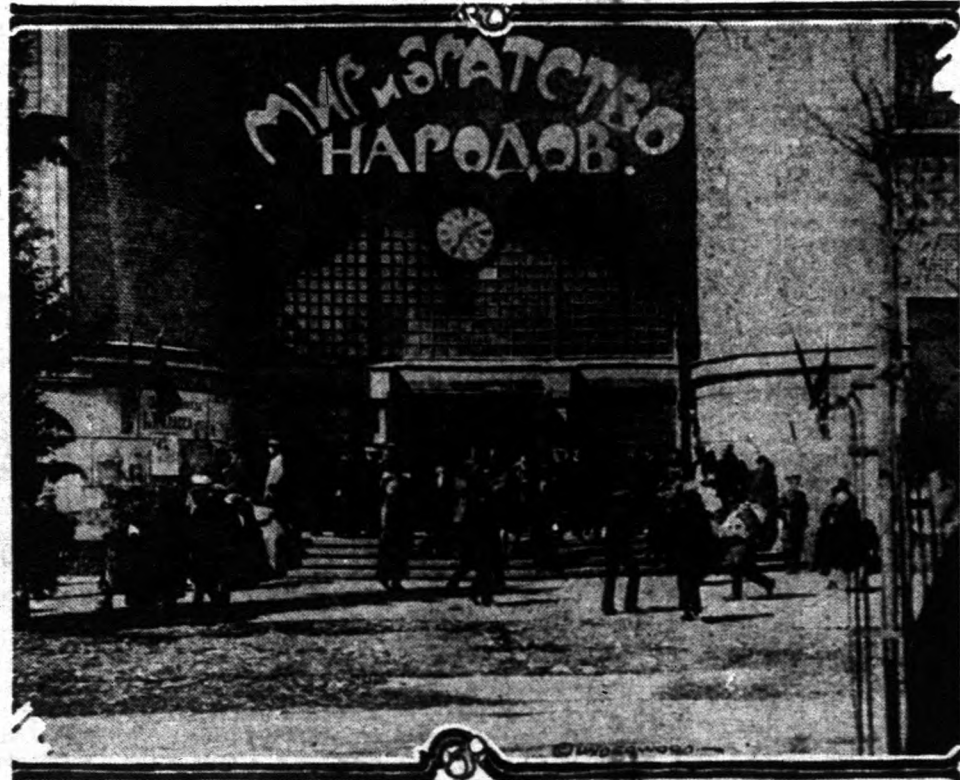
Moszkva legnagyobb termének bejárata, melyet a bolszevik gyűlések helyül használnak, a bejárat bolszevik (vörös) zászlókkal van díszítve. Hatalmas tábla nagy székkel van kifestve a jelszavak: Béke és testvériség minden népet.