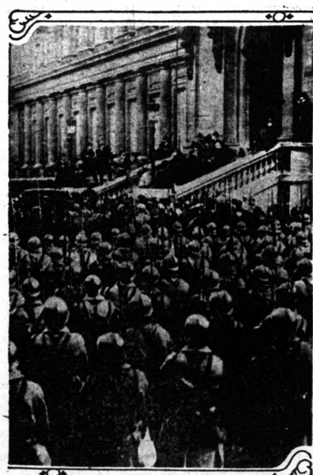
Francia katonák őrzik a Quaj de Orsay palotát, melyben a békekonferenciások folynak. Az érkező delegátusokat nagy óvációval fogadják az a tömeg, mely a palota körül csoportosul.

Az elnököt hozó George Washington hajó elé négy hadihajó ment, s ezek kíséretében jött be Brestbe. Az elnök fogadására Brestbe jöttek E. M. House ezredes és Jusserand washingtoni francia nagykövét a feleségével. Az elnököt és társaságát Leygues tengerészeti miniszter ebéden látta vendégül.