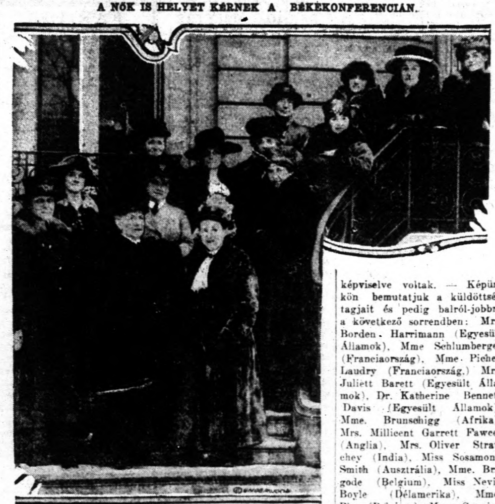
A multkoriban egy női küldöttség tisztelettel Párisban a békekonferencia elnökénél, tollmácsolva a nők ama kérelmét.