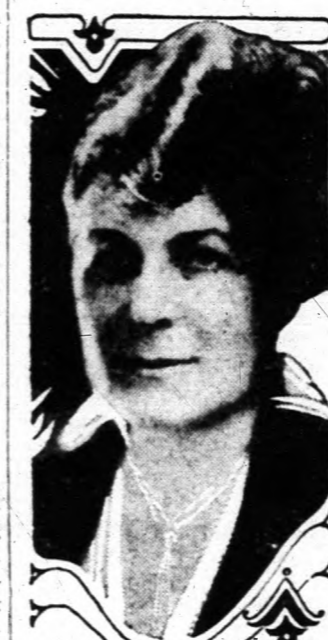
Mrs. J. Borden Harriman.

A nők már régóta törekszenek arra, hogy résztvehessenek a párisi békekonferencián. Most azután hirtelen jön, hogy sikere is van a törekvésüknek, amiképpen a szövetségesek beleegyeztek ab-