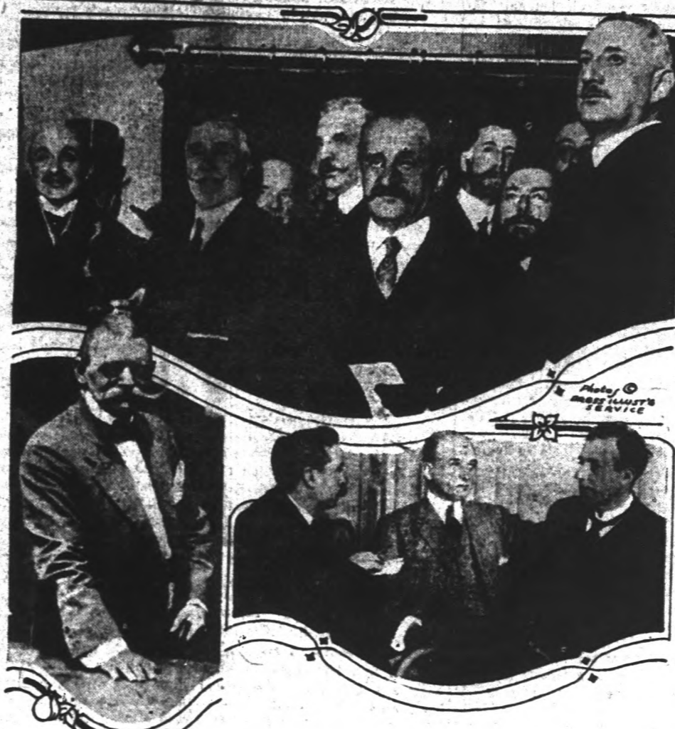
A felső képen Romanones miniszterelnök a Párisba induló küldöttség élén. — Balról Ratilo volt madridi német nagykövét, akit egy kisnép utasított ki a spanyol kormány, miután rájött, hogy minőségteljes és lelkiismeretlen német propagandát üzent Spanyolországban, mely majdnem végromlást hozott Spanyolországra. — Jobbról a berni szocialista kongressuson résztvevő delegátusokat.