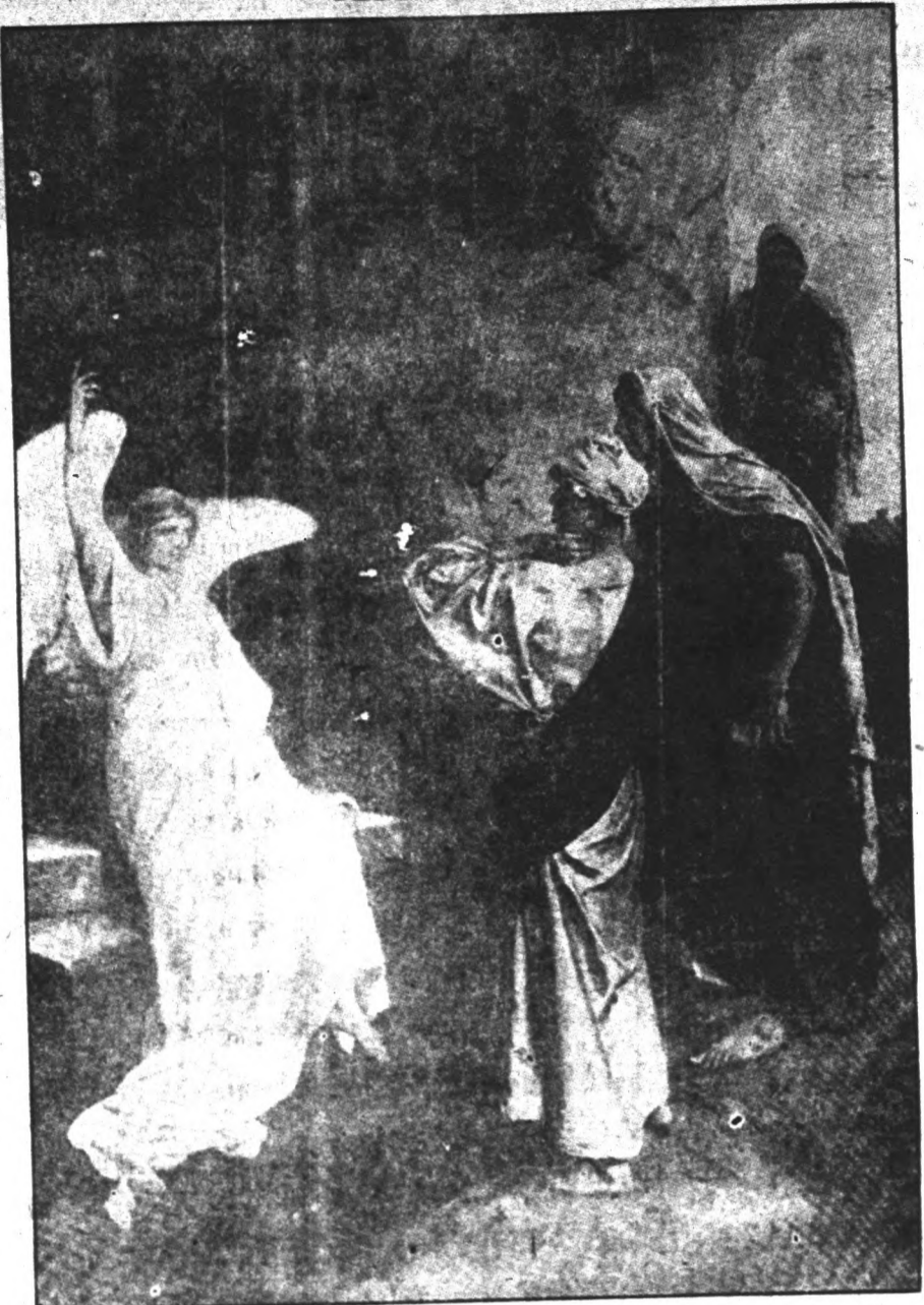
AZ UR ANGYALA: A názareti Jézust keresitek? Az Isten fia már feltámadott sírjából és ott van már a mennyekben!