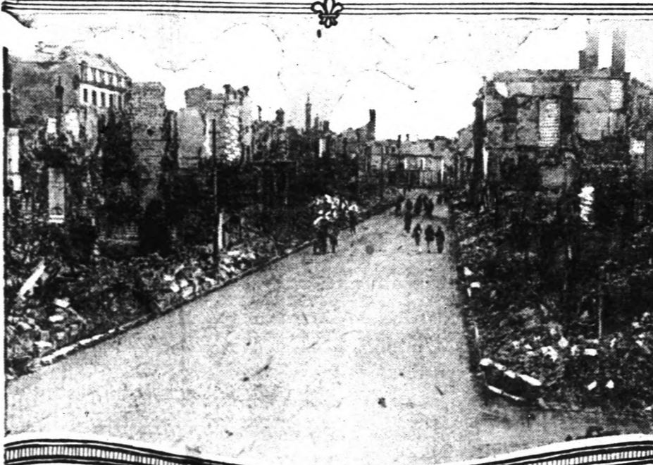
RHEIMS MEG MINDIG ROMOKBA N HEVER.

Wilson elnök és neje nemrég látogatást tett Rheimsban, hogy megtekintésék a háború okozta pusztulásokat. Az elnök látogatása alkalmából egy es utvonalakot, mint a képvonkon feltüntetett Chauy avemet is megszüntítettek, ám az egykor szépséges város világhírű katedrálisával együtt még most is romokban hever.