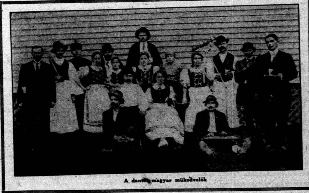
A dantei magyar műbevelők

Van azonkívül bankunk is itten az alkalmazottaink kényelmére. Ez a bank szívesen ad felvilágosítást vagy jogi tanácsot ingyen. Vannak itt magyar egyletek, továbbá két magyar zenekar: egy Magyar Rézbanda és egy vonós zenekar. Kies piknik helyek a közelben.