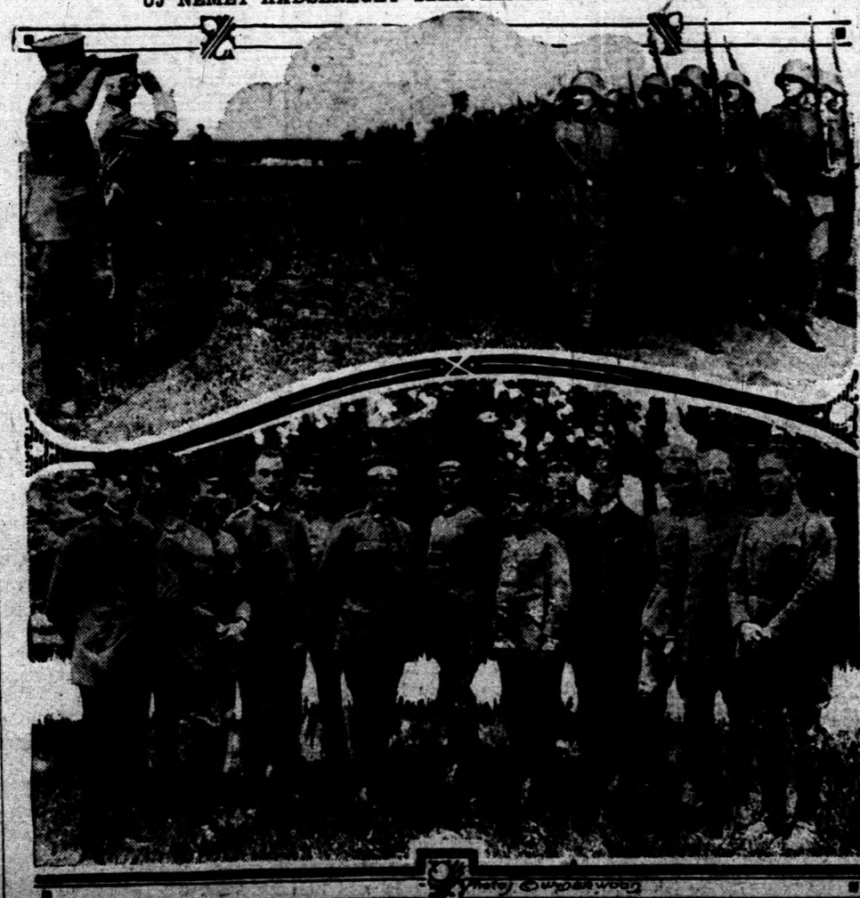
Felül: Luttwitz tábornok megszemléli a csapatokat. Alul: Lettow Vorbeck 44b. és vezérkara.

elöbbré valónak tartották. E mellett a szentink kétharmadrészt vasuton kell szállítanak, noha hiányt szenvedünk vonatokban. "Olaszország be fogja látni, hogy felelőssége az, hogy feltámassza a legyőzött nemzeteket és ilykép érje azt el, amit most megtagadtak, a nemzetek függetlenségét, a lefegyverezést által biztosítja és a munka dalára alapítva."