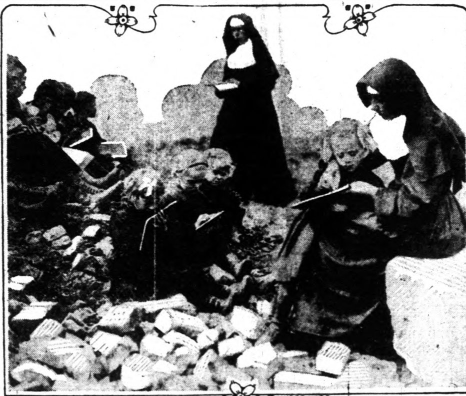
Munkában az iskola

Esszafraanciaország sok községében és falujában elpusztított minden talpalattnyi helyet a háború dühe. Romokban hevernek egykor virágzó községek, de van már élet a romok között. A francia kormány és egyes felekezeti intézmények gondoskodtak arról, hogy amíg fel nem épülnek az iskolák, a szabadban gyűljenek össze a gyermekek és ott részesüljenek oktatásban. Természetesen, mielőtt beköszöntött a tél hidege, megszűntek a szabad természetben működő iskolák