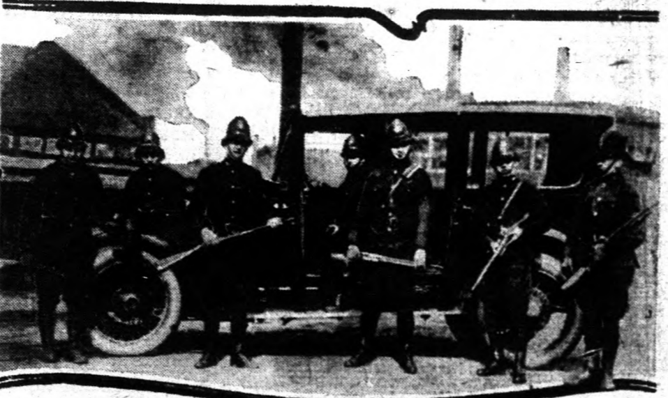
A pennsylvaniai állami rendőrség. A sztrájkoló munkások körében nagyon is oszmerék a szigorú pennsylvaniai állami rendőrök, akiket "kocak"-nak neveztek a munkások. A kocakok sok munkásarcban szerepeltek már és a munkások azt állították, hogy a rendőrök sohasem ragadták el magukat, csak minden alkalommal kötelességüket teljesítik.