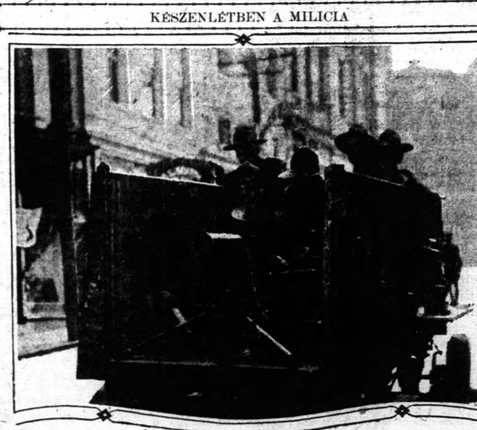
Fegyveres csapatok a közönségszolgálatában

London, nov. 10. 1918 december óta a bélyeggyűjtőknek jó idejük volt. A világon még soha annyi fajta új bélyeg nem készült, mint ezalatt az idő alatt.