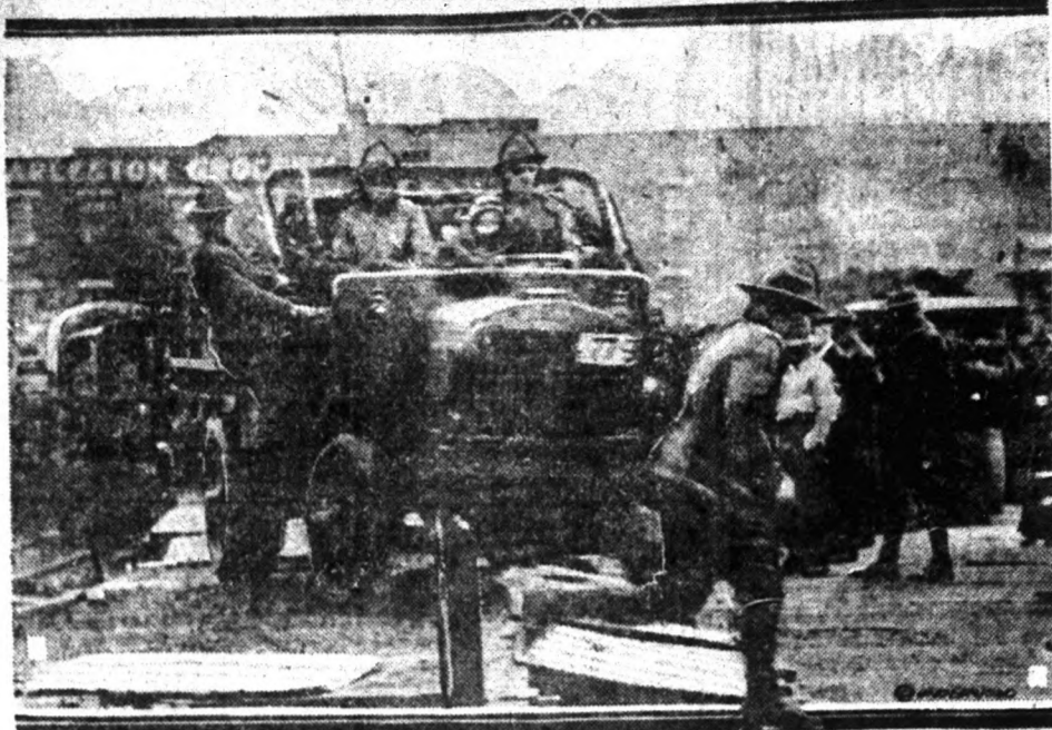
A bányásztrajk napjaiból.