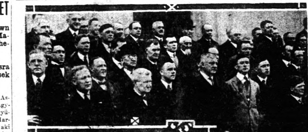
Nagyfontosságú tanácskozárok, Wilson munkügyi miniszter előküete alatt, a bányaasztárik ügyén, Washingtonban.

Ezeknek az embereknek egyezségétől függ, hogy mennyibe kerül majd Amerikában a szén.