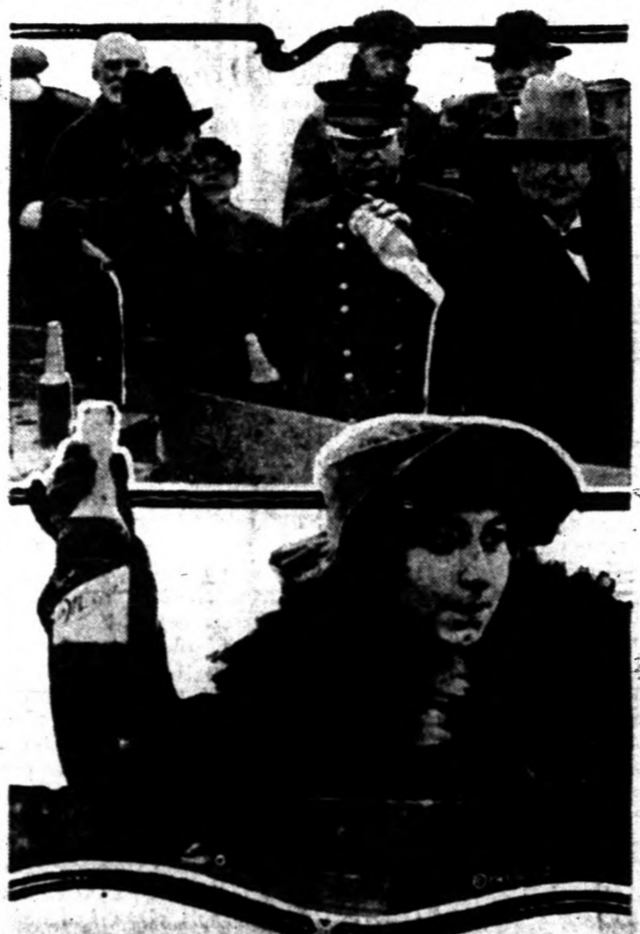
Illinois Állam Zion City városában hivatalosan is kivégezték a sört.

Huszonnyolcezerszázötvennégy üveg, valódi hamisítatlan sört öntött a városi csatornába, az elmulat héten az illinois Zion City. A sört Wisconsinban gyártották és onnan került a szép nevű városkába, melynek hatósága azonnal elfoglalta és elrendelte, hogy a legnagyobb nyilvánosság mellett öntsék a csatornába. Ez az eljárás elrettentő példa akar lenni minden bünsz lélek előtt, aki arra vetemedik, hogy sörrel fertőzze meg a becsültes városot.