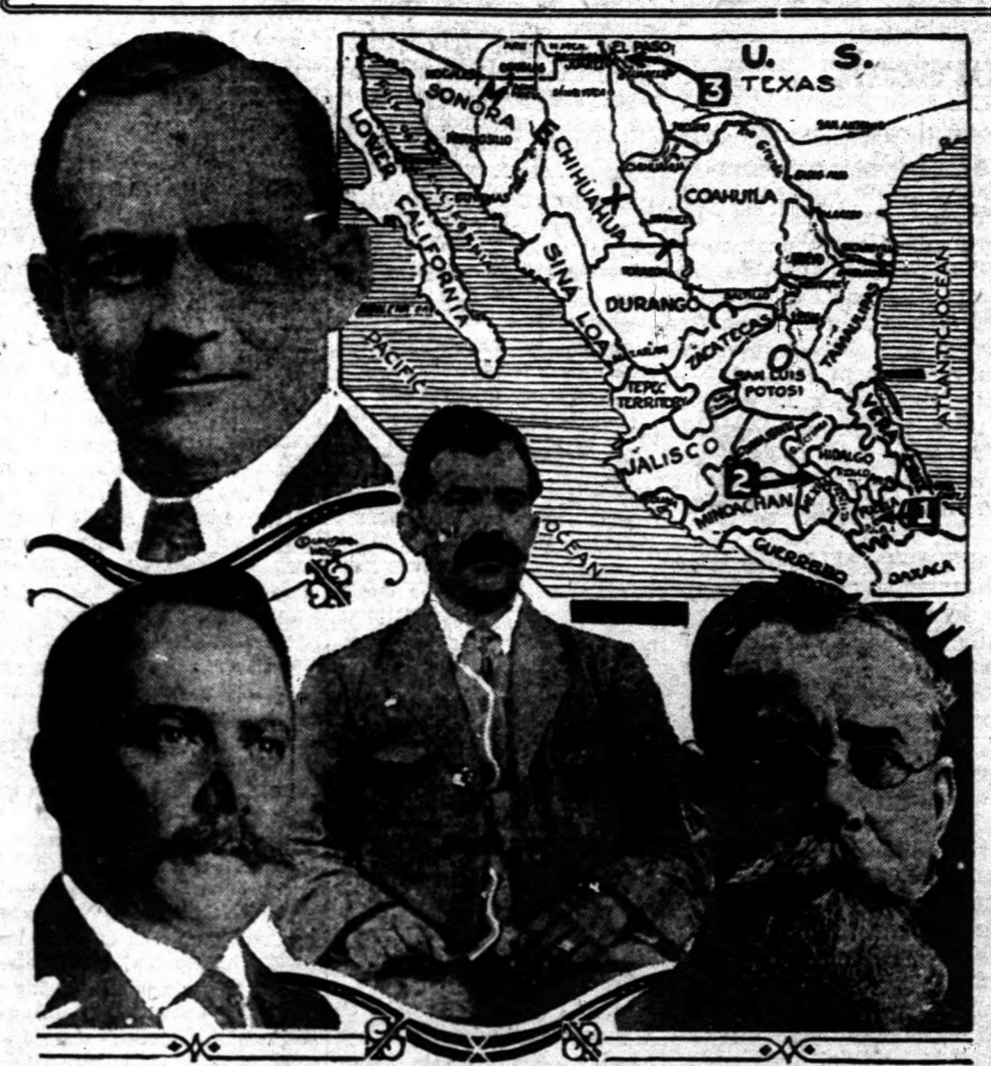
Felül: William O. Jenkins és társai, mely mutatja (1) Pueblát, ahol Jenkins fogságban tartják. (2) Mexico City, a feloldult köztársaság fővárosa. (3) El Paso, ahol teljes hadiállásban van, az események kialakulását, erős amerikai seregek. Alul, balról jobbra: Alvaro Obregon tábornok, Pablo Gonzalez tábornok és Venustiano Carranza, a mexikói köztársaság elnöke.