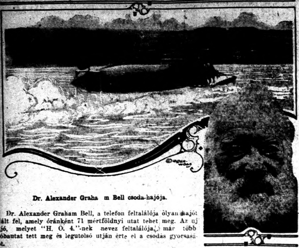
Dr. Alexander Graha m Bell csoda-hajója.

Dr. Alexander Graham Bell, a telefon feltalálója olyan hajót talált fel, amely óránként 71 mérföldnyi utat tehet meg. Az új hajó, melyet "H. O. 4"-nek nevez feltalálója, már több próbatuttatást tett meg és legutolsó útján érte el a csodás gyorsaságot.