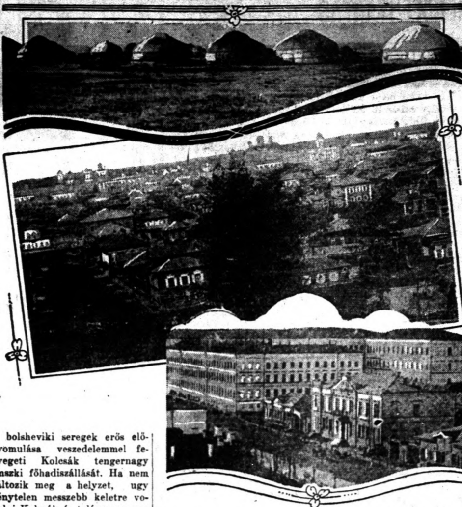
A bolszeviki seregek erős előnyomulása veszedelemmel fenyegeti Kolcsák tengernagy omszki főhadiszállását. Ha nem változik meg a helyzet, ugy kénytelen messzebb keletre vonulni Kolcsák és talán meg sem áll Irkutskig, mely 1000 mért-földdel hátrább fekszik, a Bajkál tó végénél. Az amerikai készleteiket Omszkból Irkutskba.