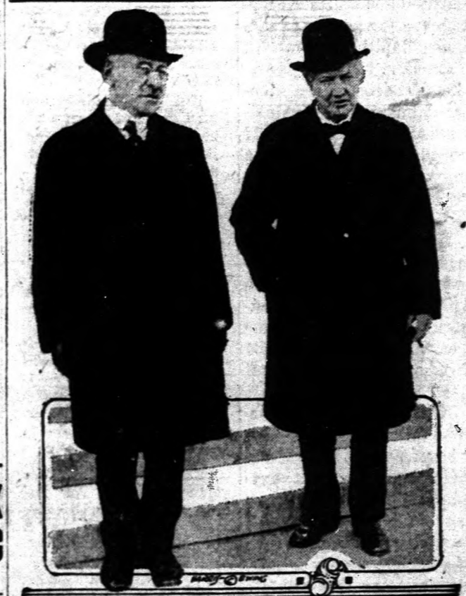
Baloldalon: Julius Rosenwald, jobbról: W. B. Wilson munkügyi miniszter.

A második ipari konferencia kevesebb zajjal, de komolyabb tervekkel kezdte meg munkáját, mint a kudarcos emlékező első tanácskozás. A második konferencia kimágnáló alakjai közé tartozik Julius Rosenwald és Wilson munkügyi miniszter, aki a konferencia elnöke.