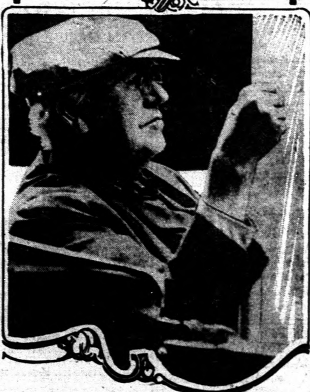
Legújabb felvétel Thomas Edisonról.

A világ legnagyobb feltalálója és talán leghíresebb élő embere: Thomas Alva Edison, a napnak egyetlen pillanatát sem szalasztja el, ha egyetlen módja van rá, hogy hosznosan értékesítse. Az újságolvasást akkor intézi el például, ha egyebet nem tehet. Ritkán lephet meg valaki, hogy nincs újság a kezében, ha ő maga hajtja a kocsit. De nincs kísérve, hogy legújabb találmányával megoldja azt a kérdést is, hogyan lehet egyidejűen autót hajtani és újságot olvasni.