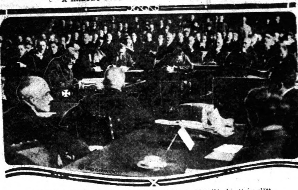
Bethmann Hollweg egykori birodalmi kancellár a vizsgáló bizottság előtt.