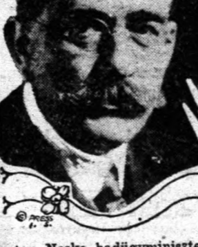
Gustav Noske hadügyminiszter, a spartaius forradalom első napjaiban tünt fel. A hadügyminiszer péntekkor grélliyel föjtotta el a vörösök lázadását és ma ült tartják Németország legerősebb keleti politikusaiknak. Noske volt az, aki határozottan kijelentette, hogy a Versailles békeszerződés záradékait nem fogadják el a német köztársaság.

Mindenhol az említett területeken épen úgy emelhetik a szénárakat, mint a legnagyobb bűség volna.