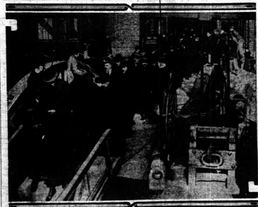
Tömegesen érkeznek a letartóztatott idegen vörös írgatók Ellis Islandra.

Az Egyesült Államok történetében példátlanul áll az a nagyarányú hajszó, mely az elmúlt hét szombatira virradó északán kezdődött meg harminchárom városban egyszerre. A legtöbb letartóztatás természetesen New Yorkban történt, a radikálisok főszínházában. A new yorkiakat azonnal "Ellis Islandra szállították és legnagyobb részük ott is marad mindaddig, míg be nem tesséklik őket arra a földszóra, mely hazaszállítja őket szülőföldjükre.