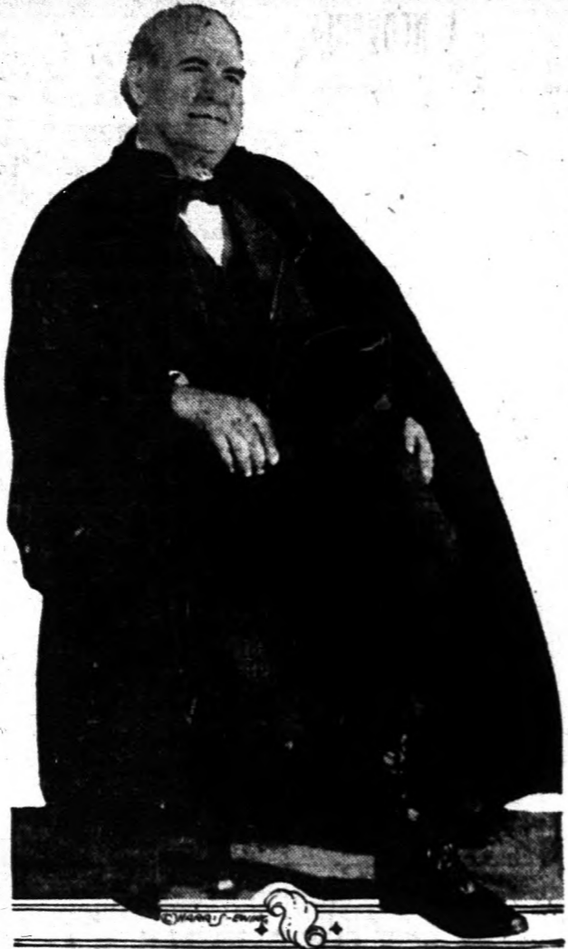
William Jennings Bryan.