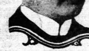
Nagy tömegek felvonulása az Unter den Lindenen. — Erzséberger pénzügyminiszter fényképe.