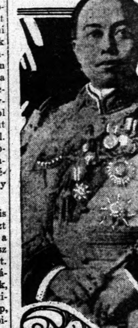
IV. Rama király.

Európából lassan-lassan eltű-nnek a királyok és már csak a feketék és félvadak között ta-lálunk igazi uralkodókat. A ki-rályok alkonya cseppet sem ár-deklí IV. Ramát, aki cifra uni-formisában rendületlenül kor-mányozza "alattvalóit."