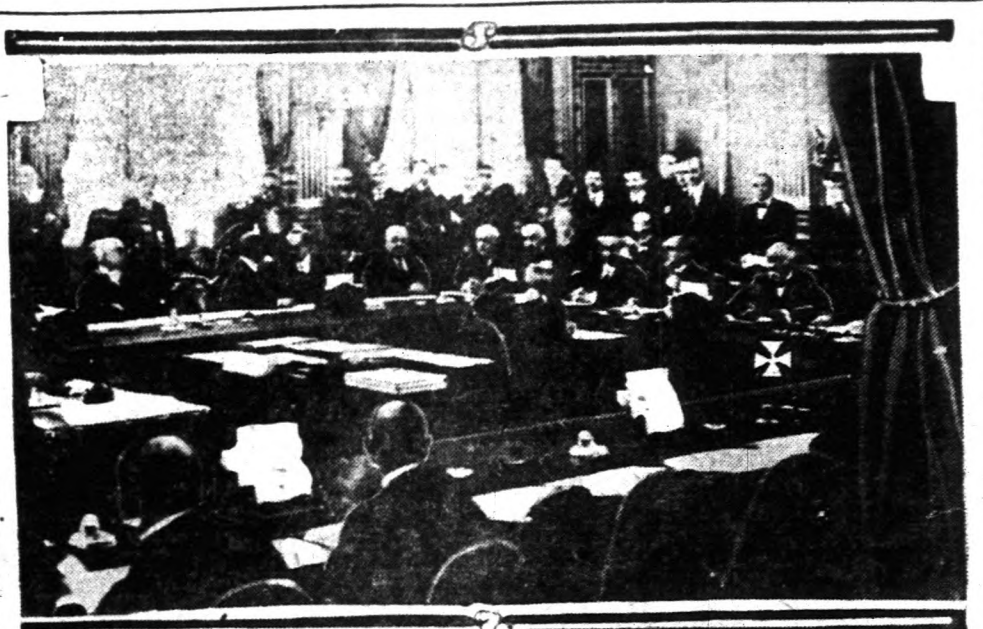
A versaillesi szerződés záradékának ünnepélyes aláírása — A kezességet jelzett alak Clemenceau, a legfelsőbb tanács volt elnöke. A francia külügyminiszter hirt "ora termében" zajlott a világháború befejezését jelentő nagy esemény: a versaillesi békeszerződés végleges jóváhagyása. Ezen az eseményen már nem vett részt az Egyesült Államok, mert amíg a szenátus nem dönt a békeszerződés ügyében, addig Amerika nevében senki sem fogadhatja el a békeszerződést.