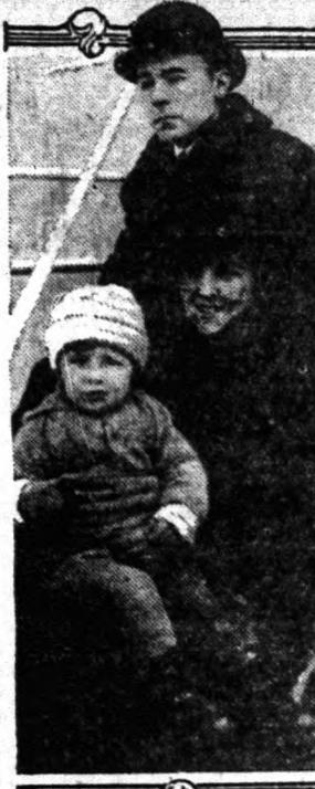
Hohenlohe Alfréd herceg, fele-leségével és kísériával.

A háború kitörése előtt idők-ben az osztrák-magyar nagykövetségi washingtoni attaséja volt Hohenlohe herceg, aki együtt távozott a kiűzött dip-lomáciai képviselőkkel. Az el-múlt napokban családijával Vla-szaékba, mintán időközben letete-a honpolgári esküt Lengyel-oroszának.