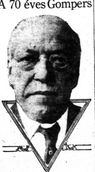
Samuel Gompers, aki harminckilenc esztendő óta az American Federation of Labor vezére, az elmúlt napokban ünnepelte hetvenedik születésnapját. A világszerte ismert munkásvérzár kijelentette, úgy érzi magát, mintha nem lenne öregebb negyven esztendőnél és még sokáig akar dolgozni.

Amerikai részről hangsúlyozták, hogy sem Wallace nagykövet, sem más valaki nem vett feljegyzéseket rész, azokban az egyezkedési tárgyalásokban.