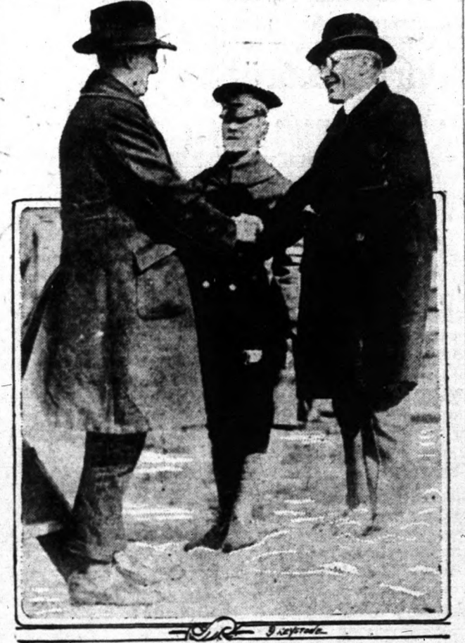
Baker hadügyminiszter kezébe a legelső ujonccal.

Az elmúlt napokban megkezdte a hadügyminisztérium a legújabb munkát, melynek 75,000 katonai toborzása a célja. Washingtonban kezdődött meg a toborzás és a hadügyminiszter személyesen résztvett az első felvonulásban és meleg kézzorítással üdvözölte az első ifjút, aki felkészült Uncle Sam-nek.