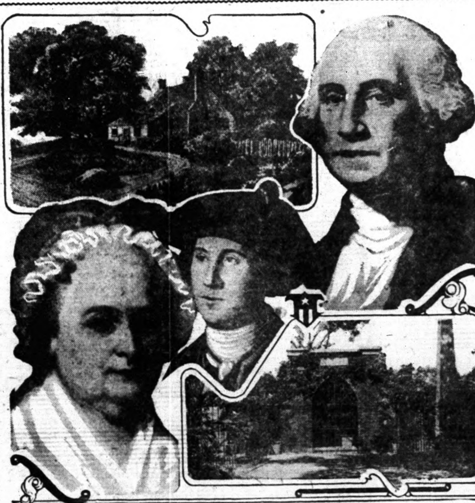
Washington Györgynek, feleségének, szülőháznak és sírboltjának képe.

A felső sarkokban: Virginia állam Westmoreland megyéjének az a helye, ahol Washington György született. — A jobb sarkokban Washington legkedveltebb és legismertebb arcképe. — A középső kép Washington Györgyről készült festmény másolata, melyet 1772-ben festett Charles Wilson Paele, amikor a "haza atyja" negyven esztendő volt. — A bal sarkokban Martha Washington képe, melyet a haza atyja a feleségéről készült legjobb képek tartotta. — Alul Washington sírboltja Mt. Vernonban.