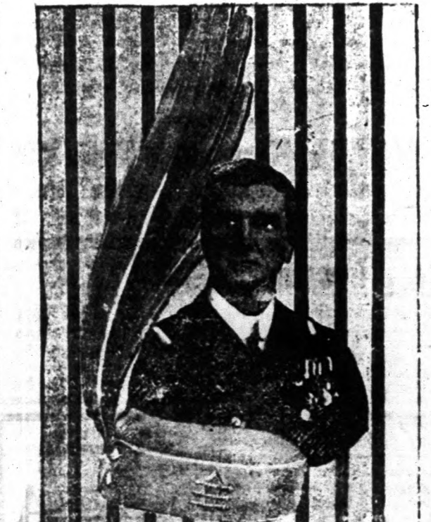
Horthy Miklós, a magyar hadsereg fővezére.

Névtelen tőlből kapjuk a következő levelet: Nagybányai Horthy Miklós nekünk magyar tengerészeknek már régóta fogva eszményünk volt. Bátor, kötelességtudás, fegyverzettség és ötletesség jellemezték Alant, úgy a tisztek, mint a legénység, rajongtak érte s egész legendákör képződött körülötte. 1903. nyarának egy szirkós éjszakáján ismertem meg. Akkor sorhajóhadnagy volt. Egy torpedónaszád parancsnoka, míg én a háború folyamán elsüllyedt Wien esatahajón teljesített szolgálatot. A nyári nagy manőverek idején történt. A feladat az volt, hogy a Quarnero előtt cirkáló esatahajóraj a szigetek között lapangó torpedónaszádok támaszra kerüljön. Zizegve, susterogva gyulnak ki a villamos reflektorok és nappali világításba helyezik egy percre az észrevetve halászesónakot. Minden szem odafigyel, a tisztek látesővizet, azután egy kézlegyintés, "nurein Trabaki!" (a halászesónak népies elnevezése), egy kommandó: "Projektoren ab!" és ismét sötétség és esedő borul a hajóra. Úgy látszik azonban, hogy a halászesónakban jobb fogást remél, mert állandóan közelebb jön hozzánk. Mikor már vagy 500 méternyire jutott a hajóhoz (az akkori torpedóknak 1000 méterig volt a lancia-távolsága), éles, a velőgik ható szírensíviás hangzik fel róla. A hajón örült zavar, vezény-