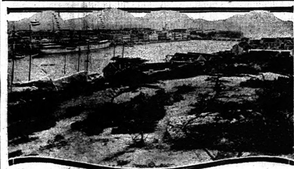
Curacao sziget hasonlevü kikötője.

A szövetségesek azt a "jótanácsot adták Hollandiának, hogy száműzze Hohenzollern Vilmost, az egykori német császárt a Venezuellai partok közelében elterülő Curacao szigetre. A sziget hollandiai gyarmat. Nem valószínű azonban, hogy a hollandiai kormány megfogadja a szövetséges nagyhatalmak jótanácsát és a "császár" továbbra is Hollandiában maradhat.