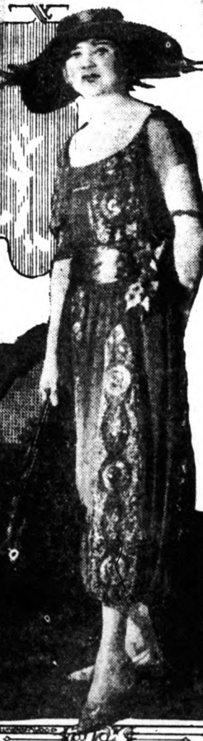
Amerikában készült ez a pom- pias párisi öltözék. Az amerikai divatkirályok ötletét surin hasz- nálják fel az amerikai üzleti szel- lep. óriásai.