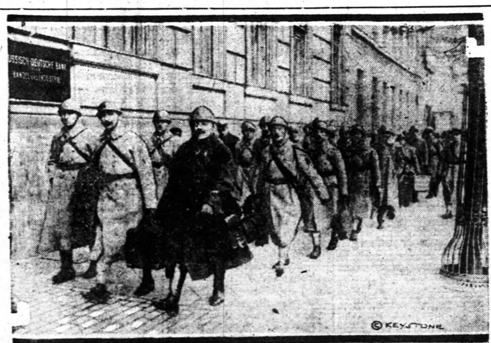
Az elmult napokban érkezett meg Berlinbe az a rendkívüli francia hadsereg, melynek feladata, hogy ellenőrizze a békeszerződés feltételeinek megtartását. A francia katonák bevonulása nagy feltűnést keltett Berlin város utcáin.